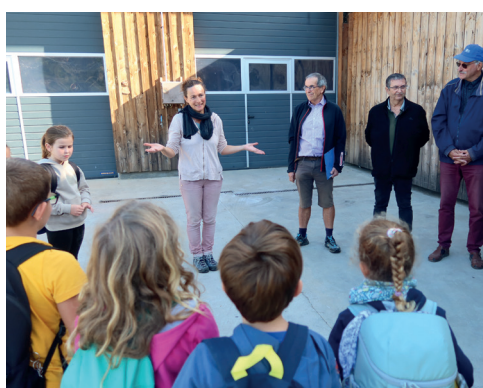
À Chomérac en Ardèche, les délégués cantonaux MSA ont organisé une rencontre entre 52 élèves et la paysanne boulangère du village voisin.