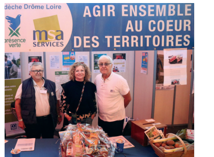
Bien manger, bien-être, prévention des risques... Sur son stand à la fête du Charolais, la MSA ADL a proposé un programme complet autour de la santé et de la prévention.