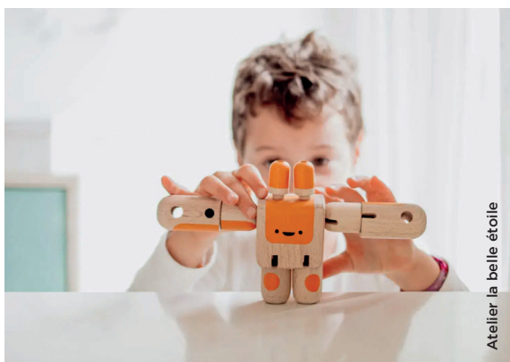
▲ Depuis la Savoie, l'Atelier de la Belle Étoile imagine des créations locales, engagées, au service de la jeunesse.