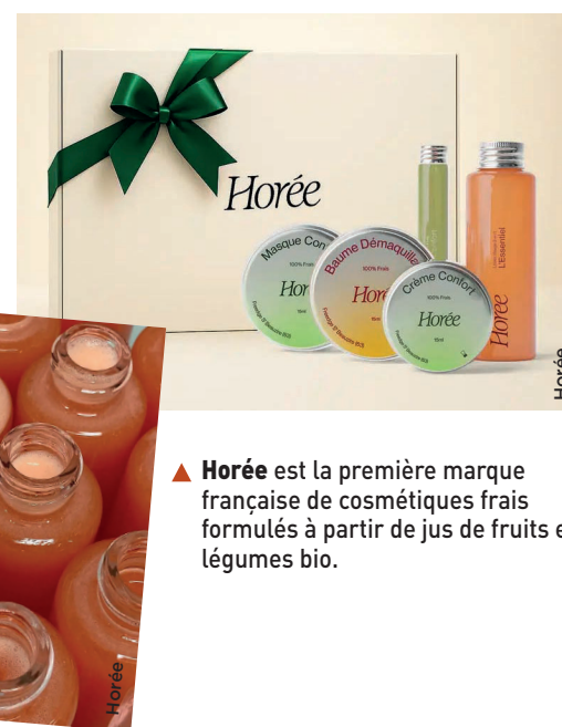
▲ Horée est la première marque française de cosmétiques frais formulés à partir de jus de fruits et légumes bio.

C'est à Clermont-Ferrand que les fruits et légumes, bio, français et de saison, sont sélectionnés puis pressés à froid le jour même dans le presseur d'Horée : carottes, raisins, pommes ou concombres livrent leurs polyphénols, bêta-carotènes et acides frais, riches en actifs, pour composer des soins visage et corps. Fondée par trois passionnés, Fabrice, Laurence et Arnaud, après des années de recherche et de développement, Horée revendique aujourd'hui une nouvelle ère de la cosmétique, plus transparente et respectueuse de la peau et de l'environnement. Les soins sont conditionnés dans des contenants en verre, sans plastique, et livrés rapidement pour garantir une fraîcheur optimale. ■