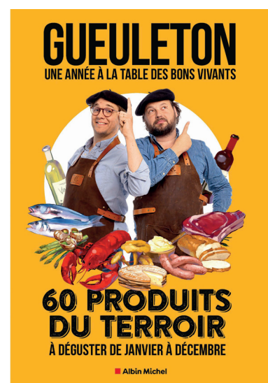
▲ « Gueuleton : Une année à la table des bons vivants » : le livre à offrir à tout bon gastronome.